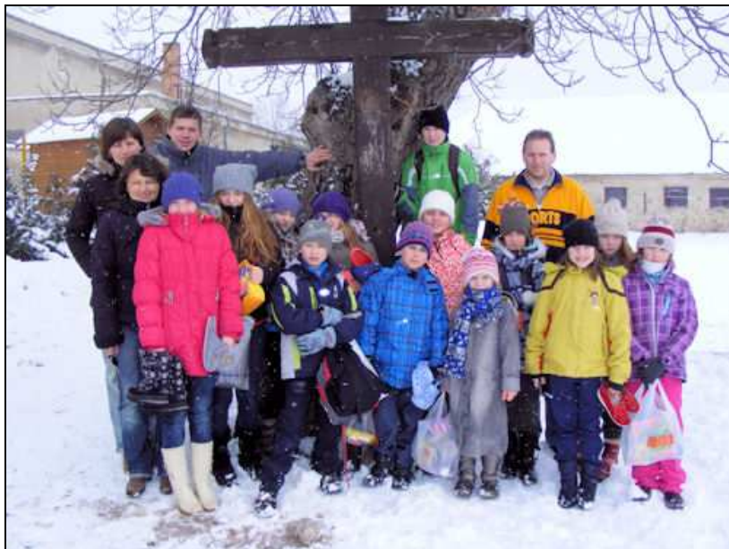
Společné foto z výletu dětí do Znojma