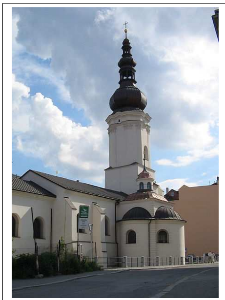
Kostel sv. Václava v Ostravě

Na pouť je možné se přihlásit do neděle 22.12.2013 a zaplatit zálohu 100 Kč na autobus. Ve chvíli, kdy farní zpravodaj připravujeme, je přihlášeno 79 poutníků. Jednou z důležitých podmínek pro uskutečnění akce je účast minimálně 100 farníků.