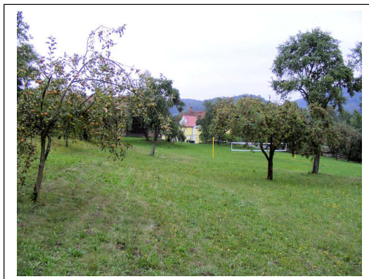
Pohled na farní zahradu