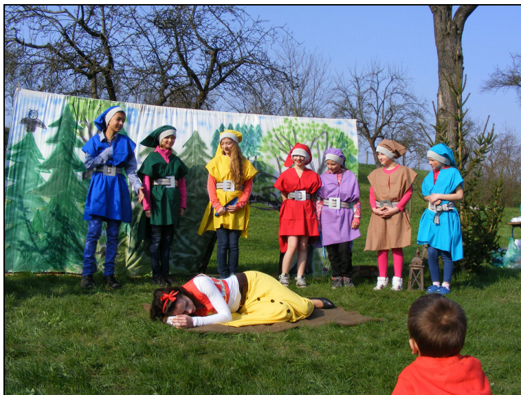
Děti v pohádce „Něhurka a sedm trpaslíků“

všechny lahodné občerstvení. Děti si pro nás nazkoušely zábavnou pohádku s názvem „Něhurka a sedm trpaslíků“, která měla veliký úspěch u diváků.