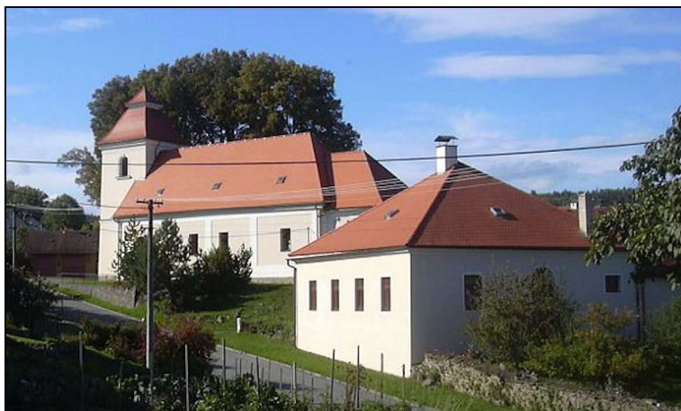
Kostel v Rychtářově

I v letošním roce se pro děti připravuje v měsíci srpnu již tradiční farní tábor. Uskuteční se na faře v Rychtářově u Vyškova, kde již proběhl první i druhý tábor pro naše farnosti. Jedná se o zrekonstruovanou faru, která je určena především pro rekreaci. V budově jsou k dispozici tři místnosti, kde jsou patrové postele, společenská místnost, kuchyň, jídelna, sociální zařízení, herna a dvůr s venkovním krbem. O program pro děti během tábora se bude tentokrát starat sedm vedoucích. V případě pěkného počasí navštívíme s dětmi i blízký aquapark ve Vyškově. A protože se jedná o farní tábor, budeme se dětem věnovat i po stránce duchovní – společná modlitba, mše svatá, křesťanské písně, ale i koupání v aquaparku, soutěže a hodně zábavy – to všechno je samozřejmou součástí programu. Tábor se uskuteční v termínu od 18.8. do 25.8.2013. Cena tábora je 2.150,- Kč. (V případě potřeby může být tato snížena o příspěvek farnosti na dítě – po domluvě s panem farářem.) Bližší informace naleznete na internetových stránkách farnosti www.mojefarnosti.cz . Možnost přihlásit se je do 16.7.2013.