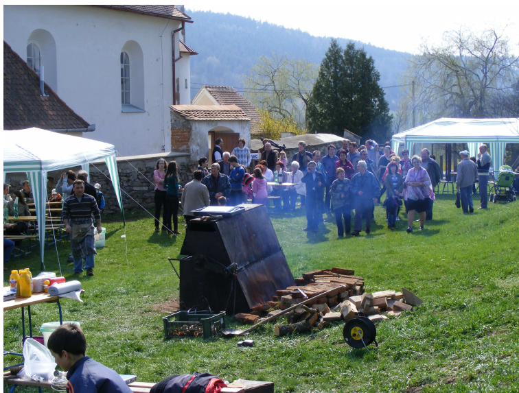
Farní zahrada byla zaplněna

I touto cestou chceme ještě jednou poděkovat všem, kdo nám s přípravou a realizací farního dne pomohli a za vaše modlitby. Doufáme, že se i následující rok bude moci podobná akce znovu uskutečnit. Záleží na tom, zda se opět najdou pomocníci, kteří se budou na přípravě a realizaci farního dne podílet.