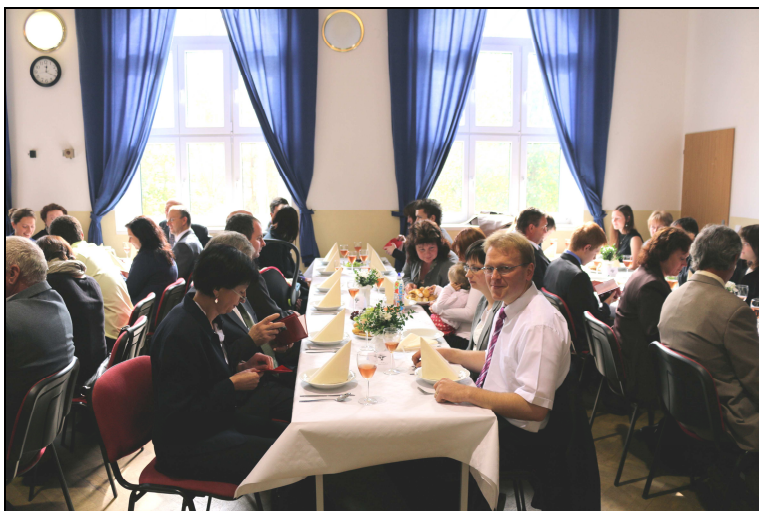
Slavnostní oběd na Orlovně