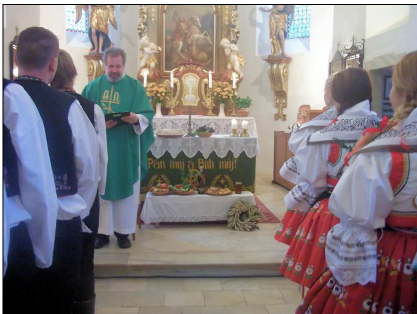
Krojovaných hodů v Olší – mše svatá spojená s poděkováním za úrodu