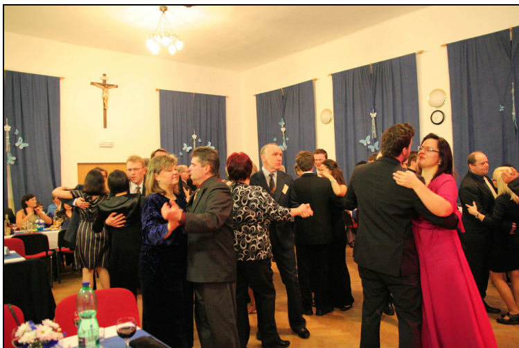
Účastníci farního plesu při tanci

Hned při úvodní skladbě se začal taneční parket plnit tanečníky. Už od počátku bylo zřejmé, že o dobrou zábavu nebude nouze, že se sešlo skvělé společenství, které se chce bavit, báječní lidé, kteří se chtějí vzájemně poznat. Všichni dohromady dokázali vytvořit jednu velkou farní rodinu, v jejímž čele stál otec Marián.