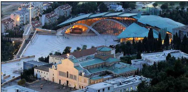
Pohled na klášter a kostel sv. Pia v San Giovanni Rotondo

Kostel sv. Pia je postaven ve svahu. Poutníci k němu přichází po rovné, 310 metrů dlouhé cestě. Na jejím konci stojí více než 40 m vysoký kamenný kříž. V blízkosti se nachází řada sloupů, mezi kterými je zavěšeno 8 zvonů věnovaných světcům. Jejich pořadí odráží liturgický význam v regionu Gargano. Před zvonící se nachází sochy 8 orlů.