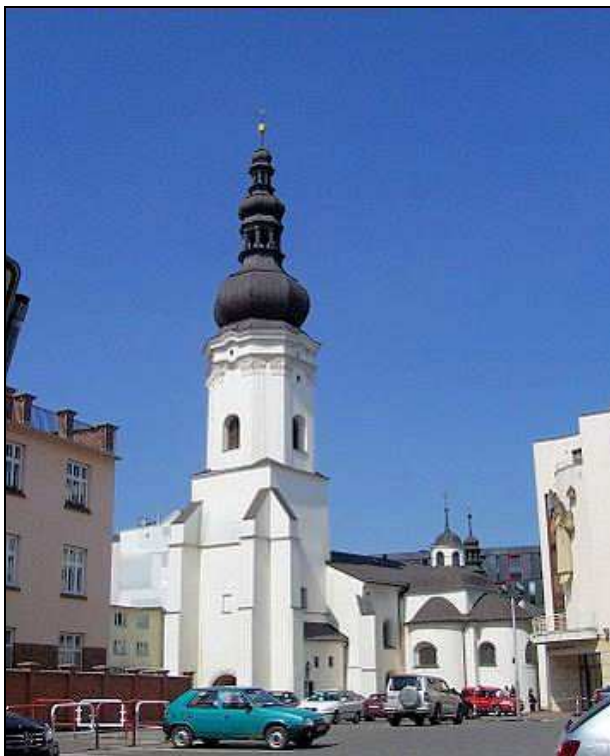
Kostel sv. Václava v Ostravě