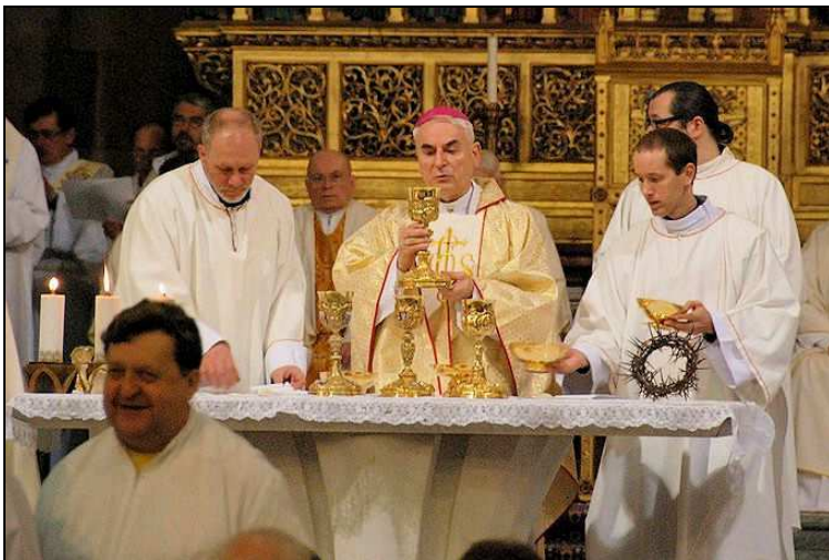
Zelený čtvrtek v Katedrále sv. Petra a Pavla v Brně

Začátek slavnosti je v 9:00 hod. odjezd od fary v Dolních Loučkách je ráno v 7:30 hod., Předpokládaný návrat bude asi ve 12:30 hod. Přihlásit se a zaplatit dopravné ve výši 100,- Kč je možné u Petry Švancarové do neděle 13. 4. 2013 (tel: 736 529 306). Protože je omezený počet míst v autech, je možné využít i vlakový spoj - z Říkonína vlak odjíždí v 7:21 hod., z Tišnova v 7:30. Do Brna na hlavní nádraží vlak přijíždí v 8:07 hod.