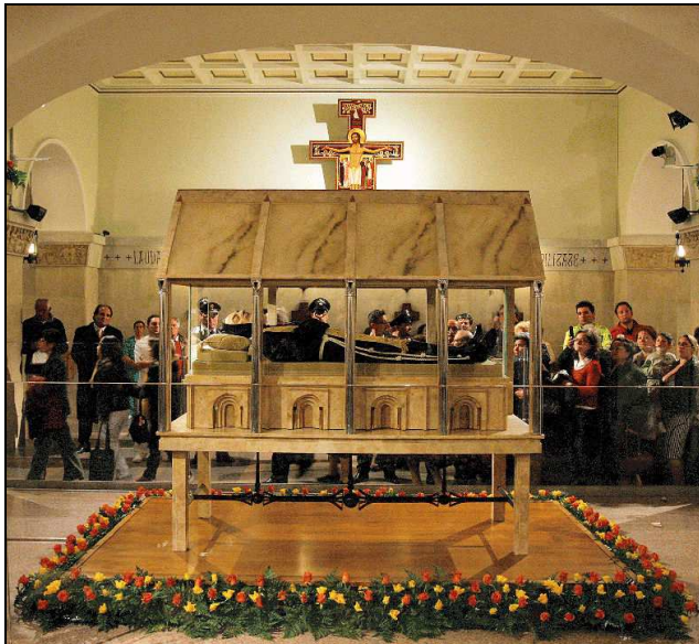
Hrobka sv.P.Pia v San Giovanni Rotondo

K dalším darům patřila i schopnost bilokace - ve stejné době býval přítomen i viditelně na dvou místech.