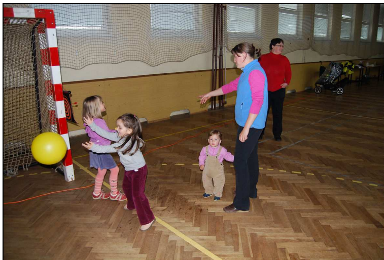
Děti si zahrály různé hry

Přes nepřízeň počasí se na farním dni sešlo více než 70 farníků, z nichž se mnozí podíleli na jeho přípravě. Upřímné poděkování tak patří všem, kdo se jakýmkoliv způsobem zapojili do přípravy a průběhu našeho farního dne a také všem, kteří na nás pamatovali ve svých modlitbách.