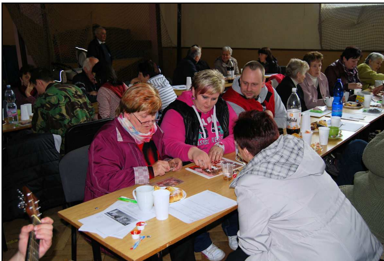
Účastníci farního dne se plně soustředí na skládání puzzle

Farní den začal odpoledne o půl třetí hodině děkovnou bohoslužbou ve žďáreckém kostele svatých Petra a Pavla. Byly předneseny Loretánské litanie, následovala promluva otce Zdeňka, který opět vyzdvihl prospěšnost fungujícího farního společenství. Pak byly proneseny přímluvy za farnost i svět a následovalo požehnání.