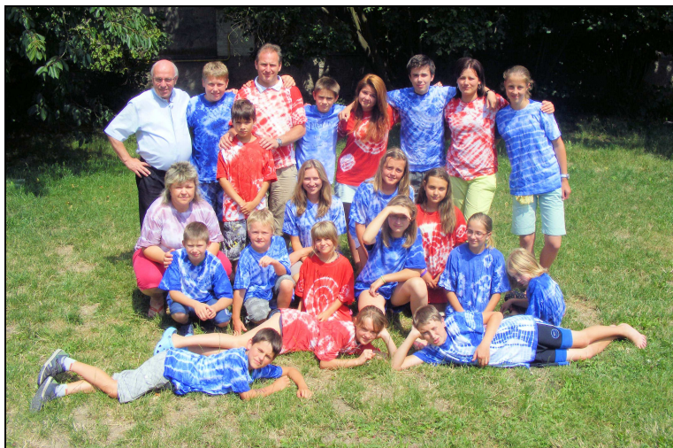
Účastníci tábora v batikovaných tričkách, která si sami vyrobili

Děti mezi sebou soutěžily ve skupinkách, vyráběly si batikovaná trička, absolvovaly i stezku odvahy, dělaly si navzájem „anděly“... Na závěr tábora byly všechny děti odměněny podle toho, co se jim na táboře nejvíce podařilo. Děkujeme všem, kteří se podíleli na přípravě a organizaci tábora.