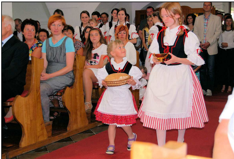
Obětní dary přinesla děvčata v krojích

Odpoledne byli ministranti od pana faráře odměněni jízdou na kolotoči.