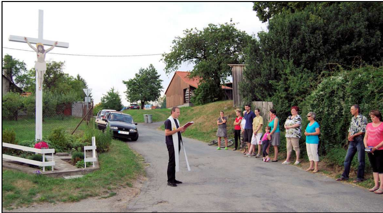
Žehnání zrekonstruovaného kříže ve Žďárce

Poděkování patří všem, kteří na rekonstrukci kříže pracovali. Zapomenout nesmíme ani na ty, kteří se o okolí kříže starají.