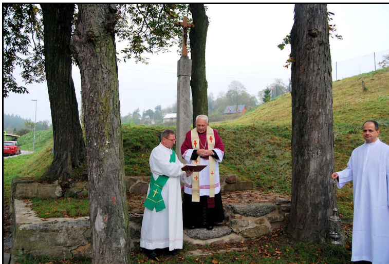
Otec generální vikář žehná křížek před kostelem

Za zpěvu písně Svatý kříži, tebe ctíme jsme se přesunuli z kostela ke křížku před kostelem. Otec generální vikář jej požehnal.