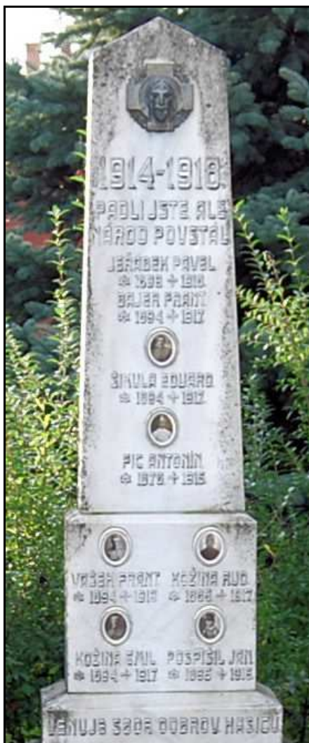
Pomník občanům Vratislávky padlým v I. světové válce

V pondělí 28. července 2014 uplynulo 100 let od chvíle, kdy Rakousko-Uhersko vyhlásilo válku Srbsku, čímž začala 1. světová válka. V aktuálním čísle farního zpravodaje se budeme věnovat další obci, která patří do farnosti Žďárec, a tou je Vratislávka.