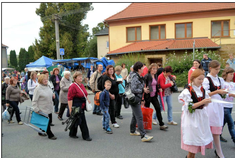
Poutníci ze Žďarce přichází na mši svatou

Poděkování patří organizátorům pouti, dívkám, které se v krojích zapojily do slavnostního průvodu a všem, kteří se pouti zúčastnili.