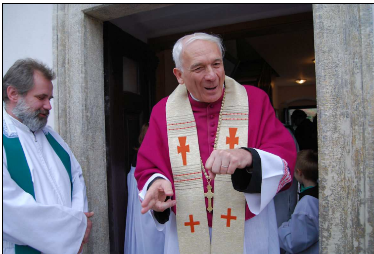
Otec generální vikář symbolicky přestřihuje pásku u zrekonstruované fary

Poté otec generální vikář nově zrekonstruovanou faru požehnal, symbolicky přestřihl pásku a všechny přítomné pozval k prohlídce fary a také k malému občerstvení, které připravilo Biskupství brněnské. Faru jsme si všichni se zájmem prohlédli a to nejenom přízemí, ale i sklep a podkrovní.