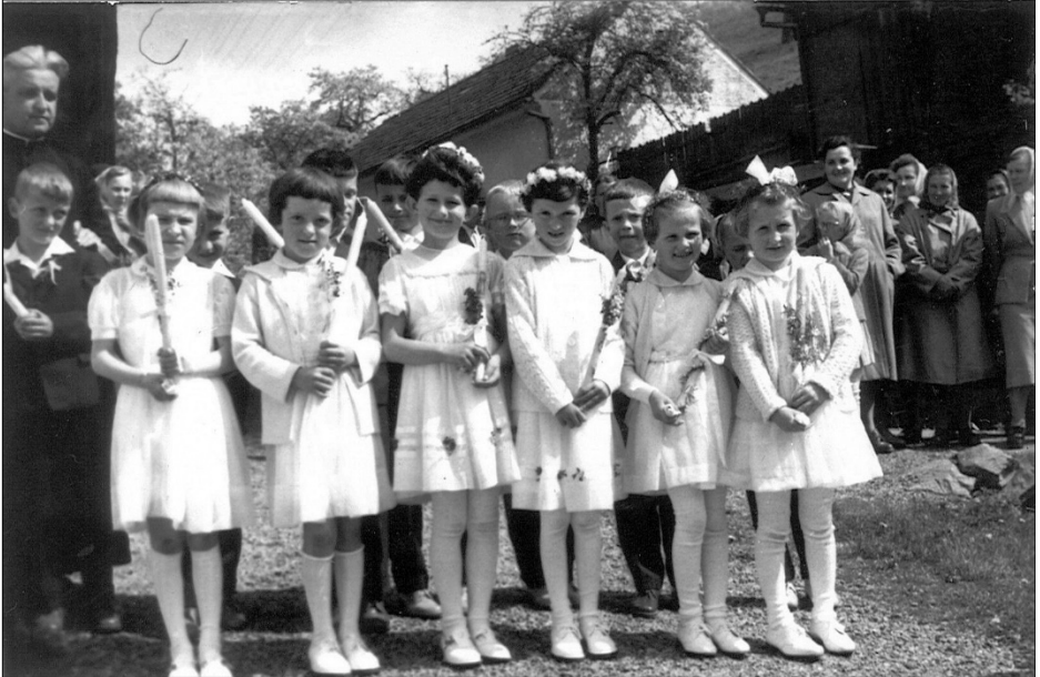
První svaté přijímání 19. května 1963