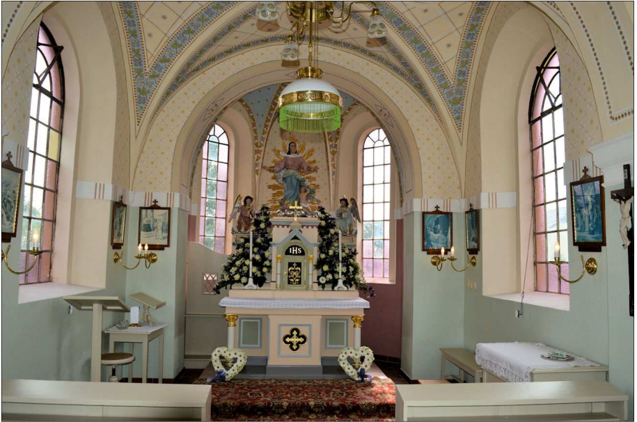
Slavnostně vyzdobená kaple Panny Marie v Tišnovské Nové Vsi