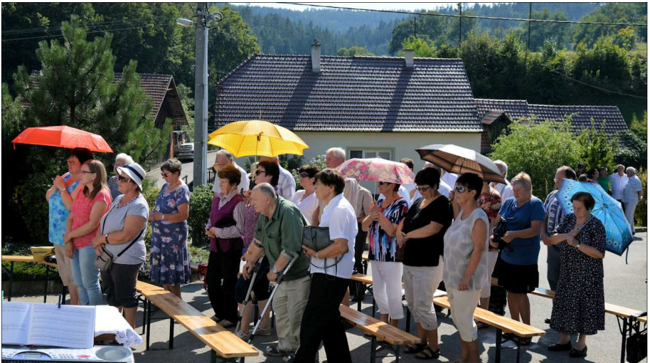
Farníci zaplnili prostranství před kapličkou sv. Jiljí v Řikoníně