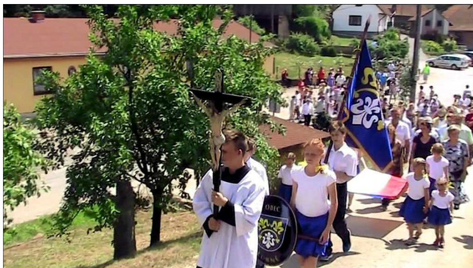
Průvod směřuje od obecního úřadu ke kapli zasvěcené Panně Marii

Dne 25. června se v malé vesničce Lubné konala velká slavnost. Ve 14:00 vyšel od obecního úřadu průvod směrem ke kapli zasvěcené Panně Marii, doprovázený "Bystřickou kapelou". V čele průvodu byly neseny obecní symboly, prapor a znak, na kterých je vyobrazena "heraldická lilie".