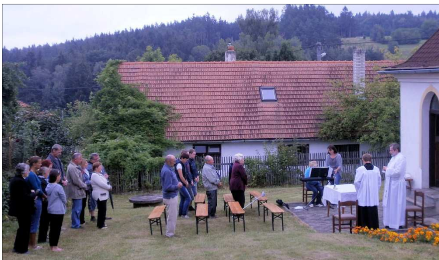
Poutní mše svatá u kaple Panny Marie v Boru