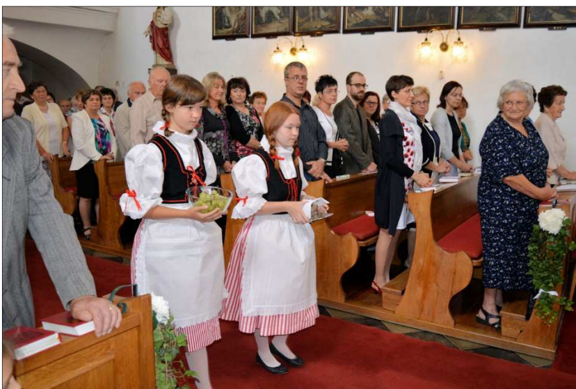
Dívky v krojích přinášejí obětní dary

V neděli 3. července se ve slavnostně vyzdobeném farním kostele sv. Petra a Pavla ve Žďárci konala poutní mše svatá. Obětní dary přinesly dívky v krojích. Věřící zaplnili nejen kostel ale i prostor před ním. Po skončení mše svaté bylo připraveno malé pohoštění – víno a koláčky.