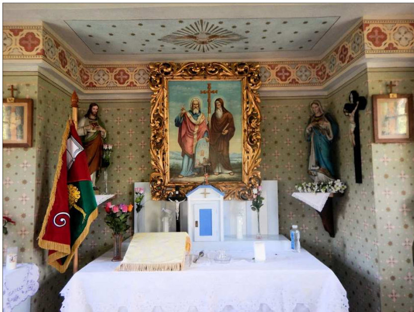
Pohled do nově vymalované kapličky sv. Cyrila a Metoděje ve Skryjích