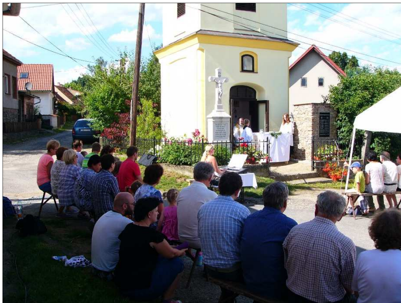
Poutní mše svatá u kapličky sv. Anny na Litavě