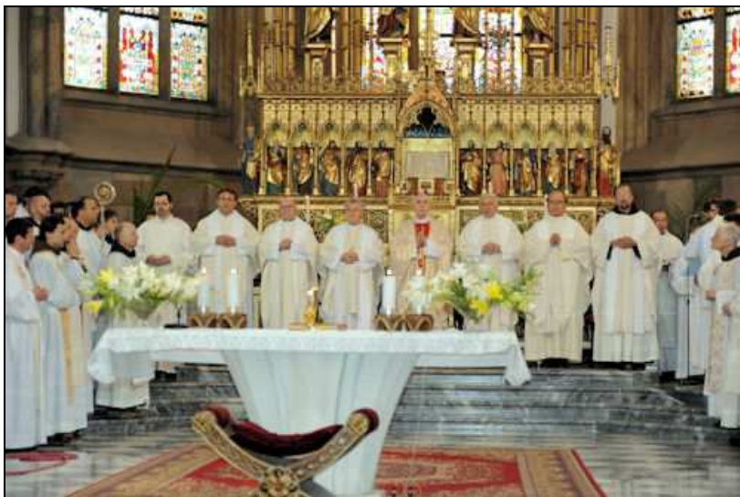
Zelený čtvrtek v Katedrále sv. Petra a Pavla v Brně