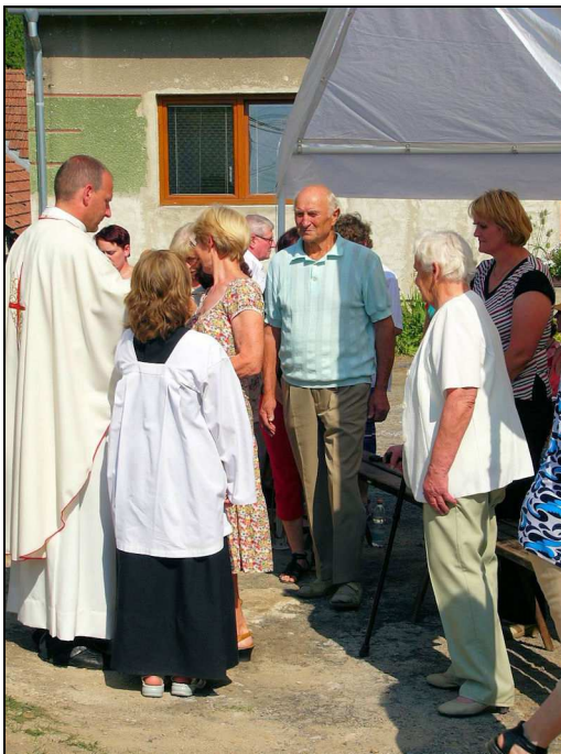
Poutní mše svatá na Litavě

Pout' na Litavě – sloužena slavnostní poutní mše svatá ke sv. Anně po mnoha desetiletích. Této slavnosti předcházela celá řada oprav zvenčí i uvnitř kapličky, obnovil se i kříž před kaplí. Mše svaté se zúčastnilo více než 120 věřících. Po mši svaté bylo pro všechny připravené bohaté občerstvení.