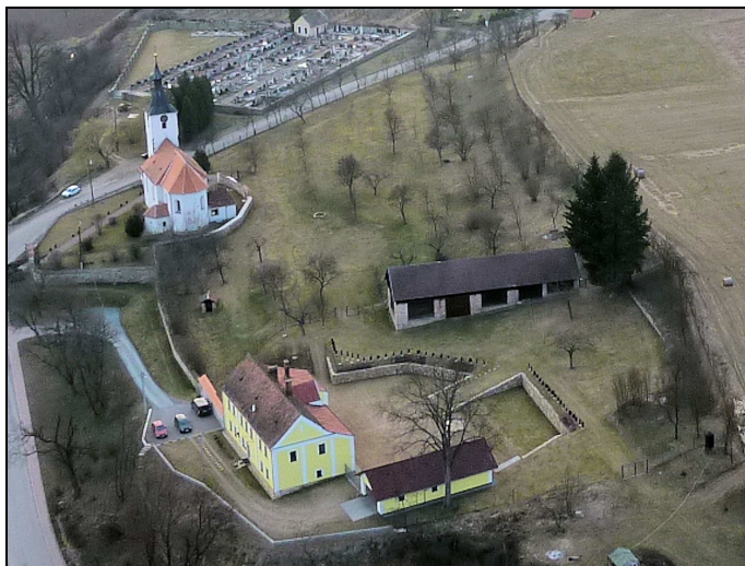
Letecký pohled na kostel sv. Martina a faru v Dolních Loučkách

Rok 2013 byl posledním, kdy se sbírky na tento účel konaly. Všem, kteří přispěli, patří veliké poděkování.