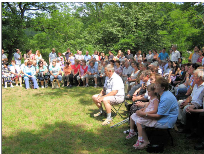
Poutní mše svatá ve Skryjích