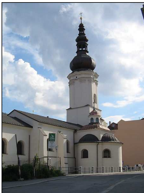
Kostel sv. Václava v Ostravě

Na pouť je možné se přihlásit do neděle 22.12.2013 a zaplatit zálohu 100 Kč na autobus. Ve chvíli, kdy farní zpravodaj připravujeme, je přihlášeno 79 poutníků. Jednou z důležitých podmínek pro uskutečnění akce je účast minimálně 100 farníků.