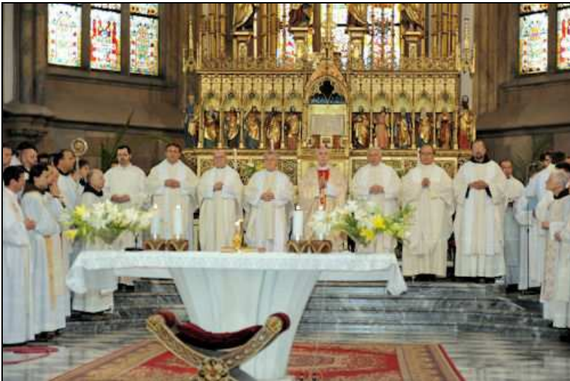
Zelený čtvrtek v Katedrále sv. Petra a Pavla v Brně